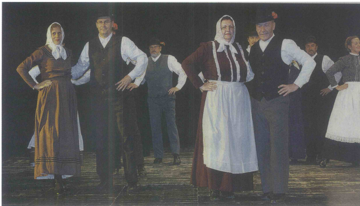
Nastopila je tudi Prekmurska folklorna skupina FD Prekmurje Lendava.