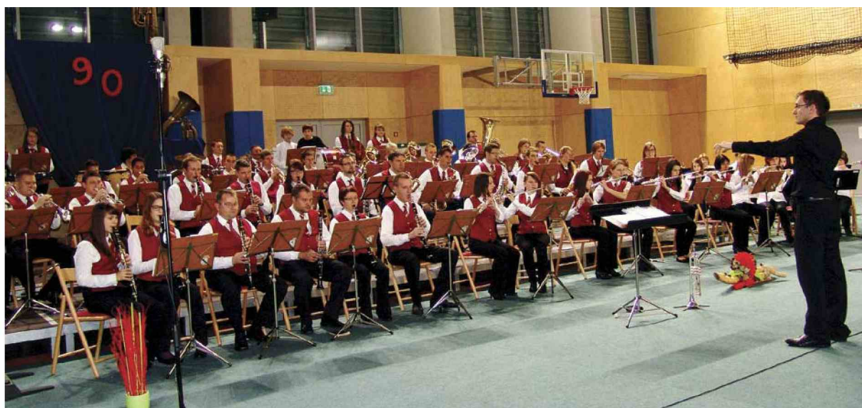
Člani ljutomerskega pihalnega orkestra so koncert ob jubileju pripravili v dvorani ŠIC Ljutomer.